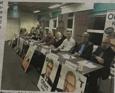
Der var mødt hele 12 byrådskandidater op ved vælgermødet i Sædding Centret, og de havde alle, på hver deres måde, en hel del på hjerte.

helt hotte samtaleemner er, hvordan man dog skal lykkes med at tiltrække flere og yngre borgere til byen.